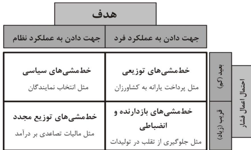
شکل ۱-۱. دسته‌بندی انواع خط‌مشی براساس هدف و احتمال اعمال فشار (الوانی، ۱۳۹۵: ۱۱۴)

به یک فرد یا سازمان اجازه می‌دهد که به مثابه یک مأمور برای امری خاص فعالیت کند. این خط‌مشی‌ها در حکومت عموماً به تأسیس واحدهای جدید، نحوه توزیع منابع مادی درون دولت و قوانین مرتبط با مستخدمین دولت می‌پردازد. مثل تأسیس وزارت ورزش و جوانان، تشکیل شورای رقابت و تصویب قانون مدیریت خدمات کشوری. در مدل جدید سازمانی، خط‌مشی‌های چهارگانه فوق، با توجه به دو عامل «احتمال و امکان اعمال فشار و مجازات از سوی دولت» و همچنین «هدف از اعمال فشار و کنترل دولت» به چهار دسته تقسیم می‌شوند: